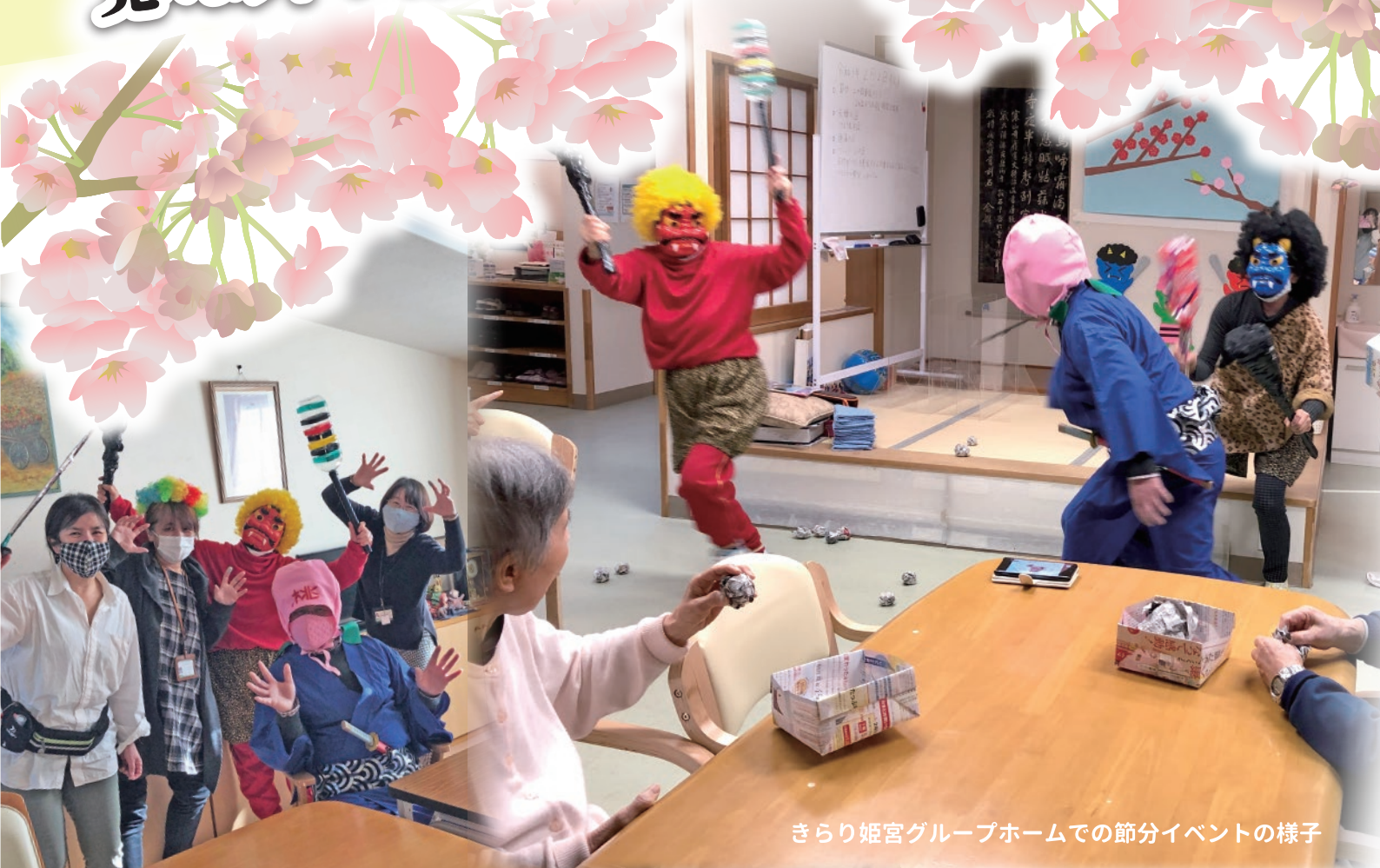
きらり姫宮グループホームでの節分イベントの様子