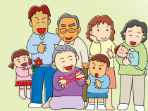
(初代きらりびと家族)

「きらりびと広場」へのお便り、いつもありがとうございます。いただいたご意見を少しずつ誌面に活かすと同時に、会員の皆様同士の交流の場にもしたいと考えています。寄稿、ご提案、励まし、お叱りなど、様々なお声をお待ちしています。