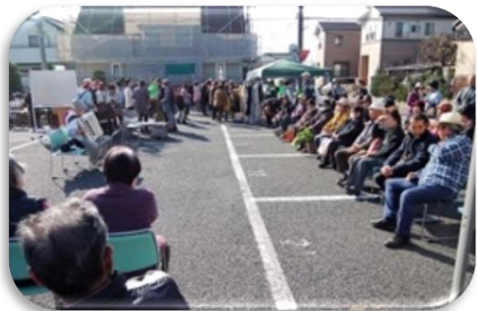
ボランティアの若いマジシャンやアコーディオンに大盛り上がり