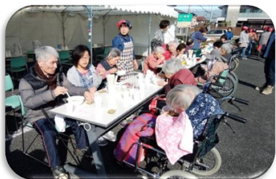
たくさんの方が集まって賑やかにテントもいっぱい！そば祭り大成功！