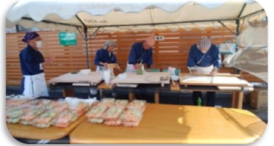
駐車場で蕎麦を打ってお客さんをお待ちしています