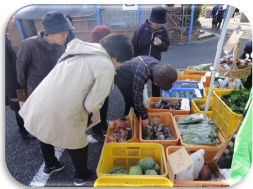
バザーも新規就農者の野菜も大人気です！