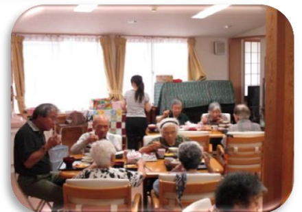
理事長も一緒に昼食