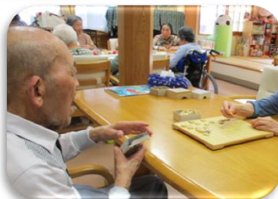
今日は将棋で勝負！