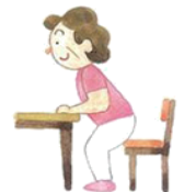
つかまってスクワット

特に大事なのが、しっかり栄養をとることとしっかり活動(運動)することだそうです。 筋肉 の元になるたんぱく質をとることを意識しましょう。卵や肉、魚、納豆はたんぱく質が豊富です(食事制限のある方以外)。 筋肉を落とさないため には、簡単な運動(かかとあげ)や、散歩などの有酸素運動をすることが効果的だそうです。