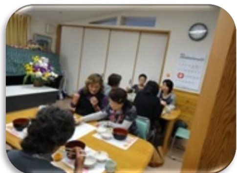
昨年（H26年）の見学・食事会