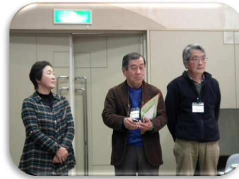
助け合い活動発表者 3