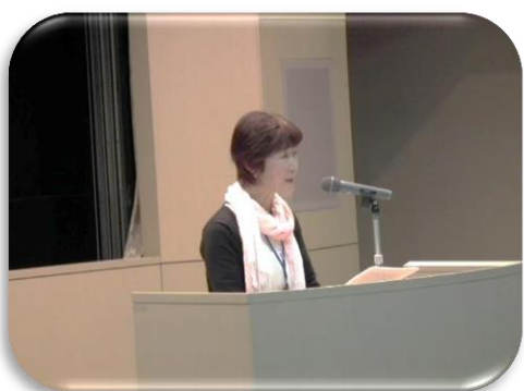
助け合い活動担当者