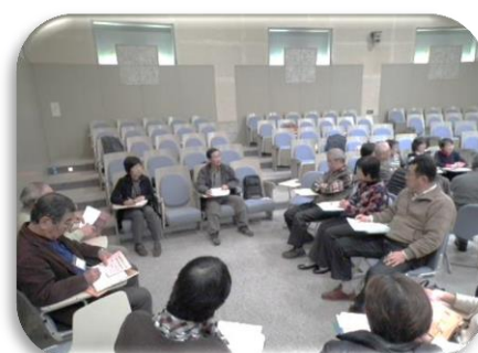
3グループにわかれての懇談の様子