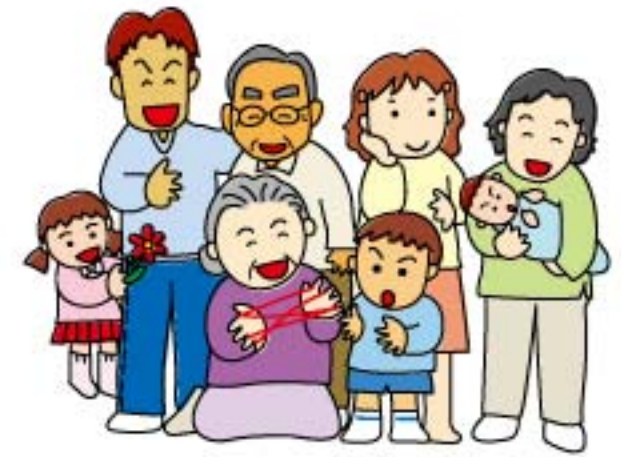
(初代きらりびと家族)

「きらりびと広場」へのお便り、いつもありがとうございます。いただいたご意見を少しずつ誌面に活かすと同時に、会員の皆様同士の交流の場にもしたいと考えています。寄稿、ご提案、励まし、お叱りなど、様々なお声をお待ちしています。