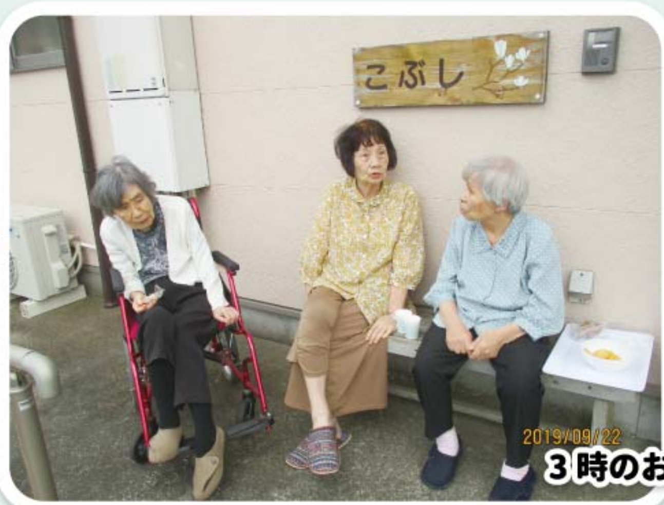
3時のお茶玄関前で